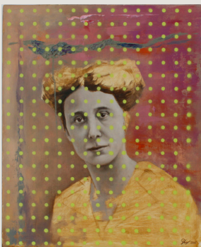
Aunty (2018) 50 cm x 64 cm