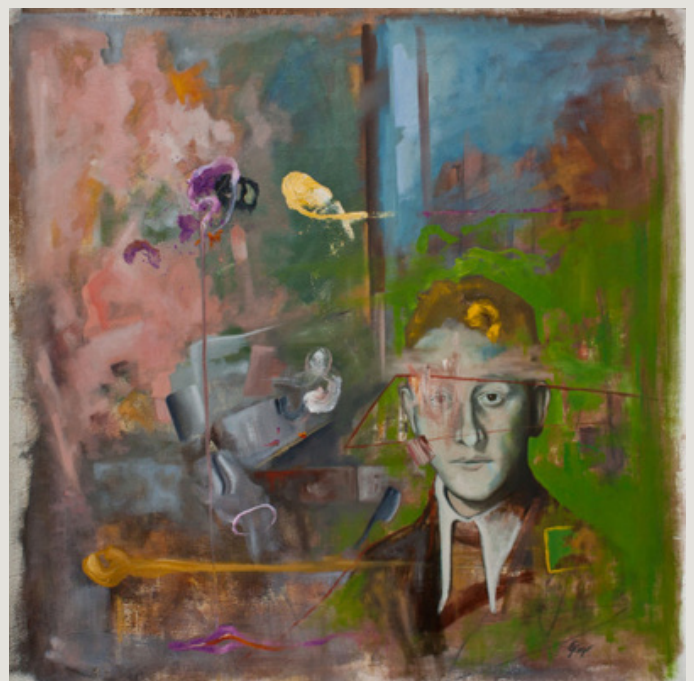
If There Was Time (2015) 86 cm x 86 cm