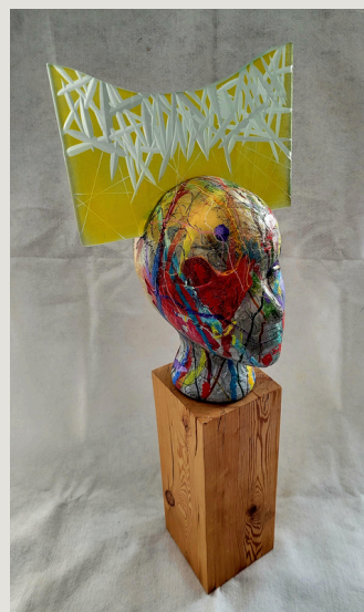
Brain Shard (2022) 76 cm x 50 cm x 50 cm