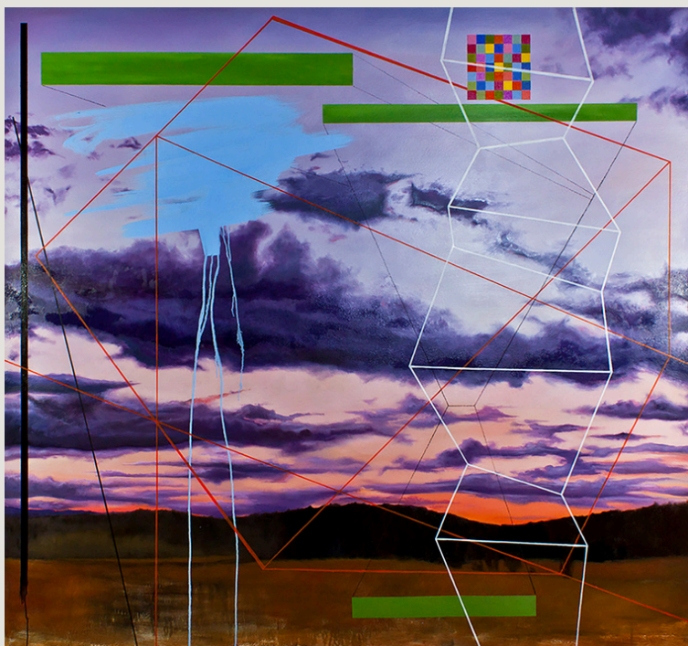
Rational Space With Late Summer Sky (2013) 195 cm x 175 cm