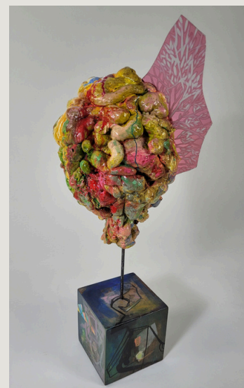
Shard Contemplating (2022) 76 cm x 50 cm x 50 cm