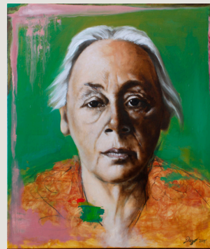
Kaehte Kollwitz (2018) 43 cm x 37 cm