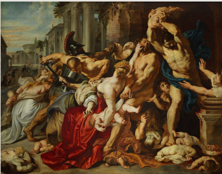
Le massacre des innocents (2018) 226 cm x 294 cm