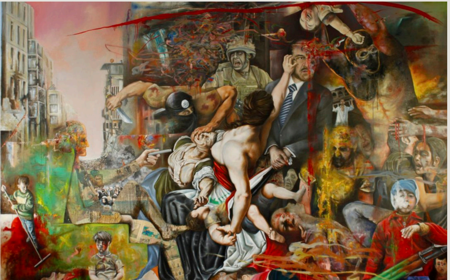
Le massacre des innocents , Detlef Gotzens (2018).

À ce message, il ajoute sa touche artistique unique, le mélange de l'abstrait et du figuratif, qui inscrit l'image dans son actualité.