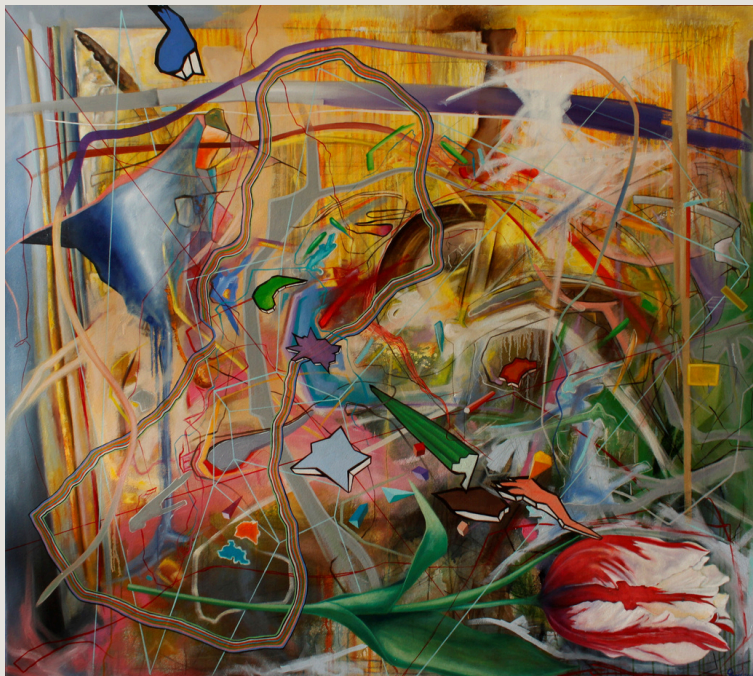
After Easter No Chocolate (2014) 193 cm x 174 cm