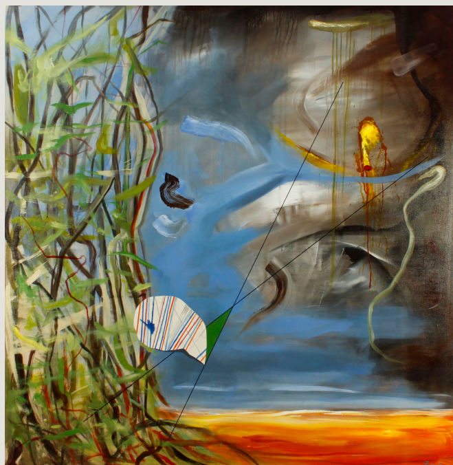
Enchanted Forest (2012) 137 cm x 142 cm